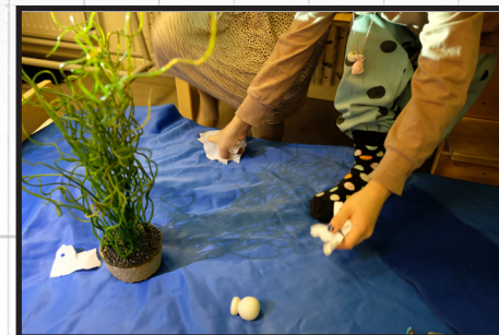
En helt egen undervattensvärld.