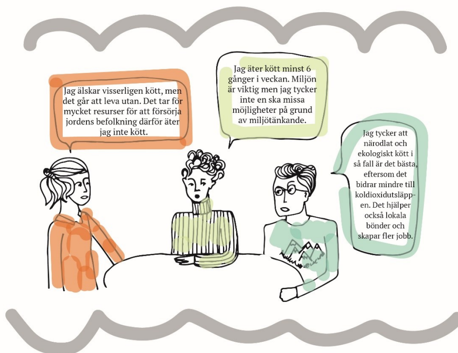
Figur 1: Olika ställningstaganden kring konsumtion av kött. Illustration: Anna Hasslöf

som är ett hållbart alternativ? Hur kan vi utveckla elevers möjligheter att se olika aspekter av detta? Vi startar i ett exempel från en workshop under våren 2019, med åtta elever från en gymnasieskola i södra Sverige, åk 2 och 3 på samhällsvetenskapliga programmet. I workshopen diskuterar eleverna hur de förhåller sig till att äta nötkött i relation till hållbar utveckling, utifrån de kunskaper de har där och då. Under diskussionen vävs information och ställningstaganden samman och speglar de perspektiv som framträder i just detta sammanhang. Läs pratbubblorna i bilderna nedan innan du går vidare i texten.