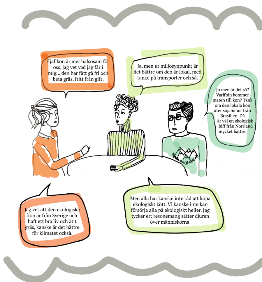
Figur 2: Exempel på argument från rollspel kring nötkött. Illustration: Anna Hasslöf

I rollspelet får eleverna chansen att tänka från fler perspektiv och behöver inte identifiera sig direkt med de argument som de känner till. Det kommer fram argument kring hur djuren mår, hälsa, giftanvändning och livsmedel, hur koldioxidutsläpp är svårt att relatera till plats och vem som egentligen har råd att välja (fig. 2). Frågor som rör etik, ekonomi, miljö, växthusgaser och geopolitiska aspekter bollas fram och tillbaka. Resonemanget här belyser komplexiteten och vikten av kritiska perspektiv då köttfrågan är i fokus, eftersom argumenten – som alla bygger på tillgänglig kunskap – leder till olika konsekvenser. Elevernas argument kan användas som utgångspunkt för vidare och fördjupande studier. Tillsammans med eleverna kan en rad frågor plockas fram från diskussion och rollspel som kan vara utgångspunkt för vidare underökningar. I detta fall skulle det te x kunna vara frågor som: Vad kännetecknar ”närodlat”? Hur mycket växthusgaser ger transport av kött jämfört med hur produktionen sker på plats? Vilka marker nyttjas och vilka för och nackdelar kan det innebära för miljön? Vilka insatsmedel används i produktionen och hur