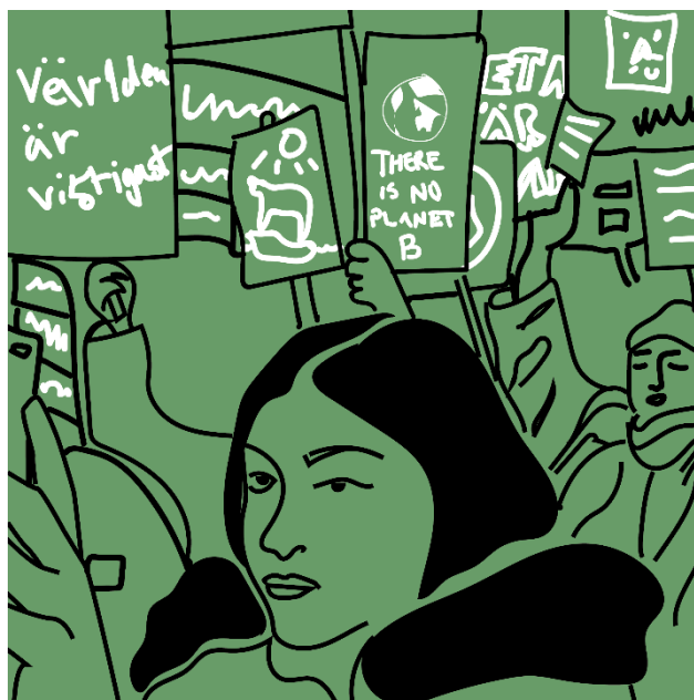
Figur 1. Agens, elevernas möjligheter till att få vara med, ta initiativ och påverka på riktigt. Illustration: Anna Hasslöf

För både motivation och relevans är det viktigt att eleverna får vara med och identifiera vad de vill uppnå med sina kunskaper som de kan användning för utanför skolan idag. Ett sätt att göra det kan vara att skapa äkta målgrupper som får bli mottagare av de kunskaper de utvecklar. Om eleverna får skriva artiklar i lokalpressen, göra utställningar på biblioteket eller upprop på nätet kan det göra att det hela känns mer reellt för dem redan här och nu.