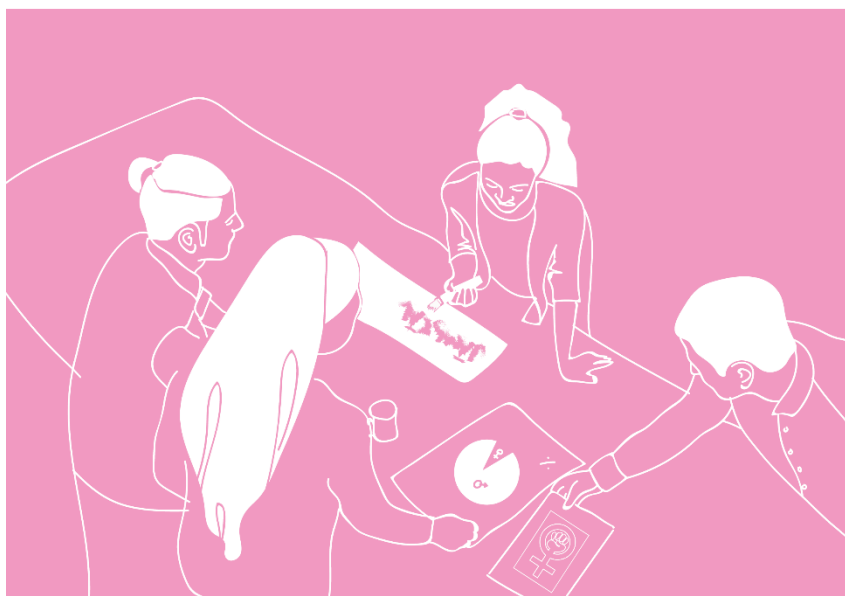
Figur 4. Kritik, en vilja att uppnå något annat än det som för tillfället är rådande. Illustration: Anna Hasslöf

Sopa trappan uppifrån, konsumenter kan inte vara lösningen endast utan företagens ansvar.