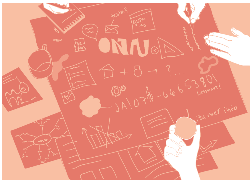
Figur 3. Kreativitet, elevers möjlighet att utveckla även sådana idéer som kanske inte finns på kartan idag. Illustration: Anna Hasslöf