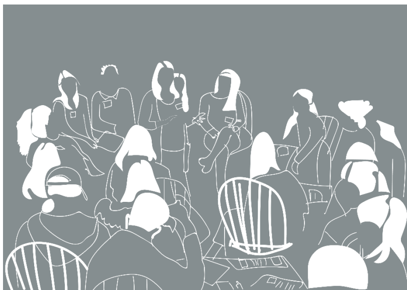
Figur 2. Deliberation, eleverna får möjlighet att sätta sina värderingar och kunskaper i rörelse i samspråk med (var-)andra. Illustration: Anna Hasslöf