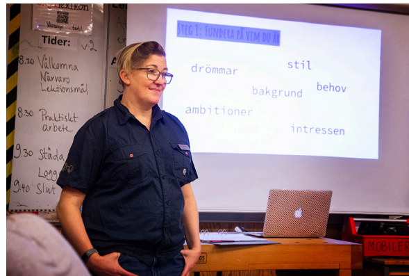
Temat för den här terminens arbete är "Mitt framtida jag".

– Vi ser ju att många av de förmågor som eleverna får öva hos oss är otroligt viktiga. De får jobba med sin kreativitet, lära sig att hantera motgångar, arbeta med bedömning av kvalitet och reflektera över sina egna insatser. Det är förmågor som nästan alla arbetsgivare vill se hos sina anställda.