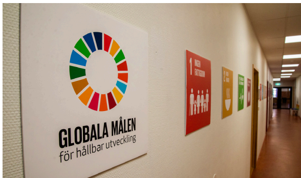
De globala målen för hållbar utveckling finns uppsatta på flera ställen i skolans korridorer.

På Oxievångsskolan i Malmö är hållbarhetsperspektivet närvarande i alla ämnen. I slöjden tar sig detta uttryck bland annat genom att elevernas arbeten skänks till välgörande ändamål. Det ger undervisningen en naturlig koppling till frågor om social och ekologisk hållbarhet samtidigt som eleverna blir extra motiverade och engagerade i arbetet.