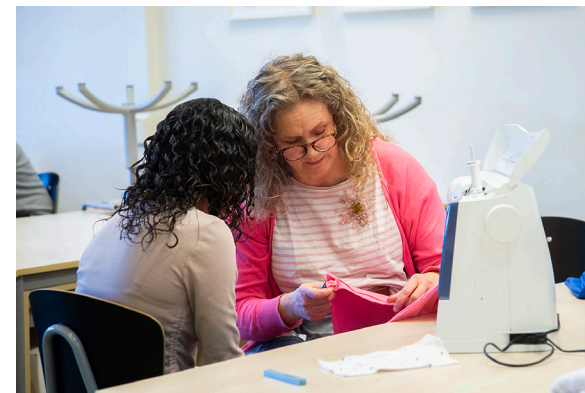
I textilslöjden tillverkar eleverna kläder som kan skänkas bort om eleven inte vill ta hand om dem själv.

– Varje termin var det många arbeten som bara blev liggande och fick slängas. Det kändes jättetråkigt och absolut inte hållbart, så vi började fundera över hur vi kunde göra för att ta vara på sakerna och