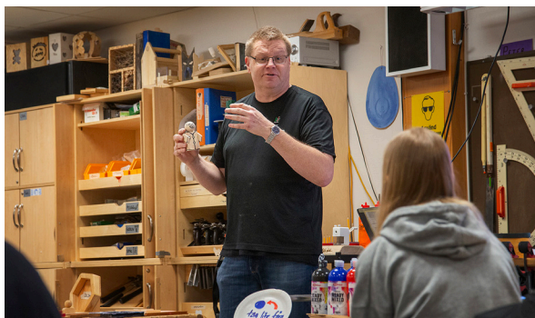
I trä- och metallslöjden tillverkar eleverna leksaker som de kan skänka till secondhandverksamhet om de vill.

Redan vid en kort rundvandring är det tydligt att hållbarhetsarbetet är något som präglar både miljön och det dagliga arbetet på F-9-skolan Oxievångsskolan. Stora skyltar med de globala målen finns uppsatta i korridorerna och mediateket, på atriumgården surrar bin runt sina kupor och i slöjdsalarna tillverkas kläder och leksaker som så småningom kommer att skänkas till Stadsmissionen.